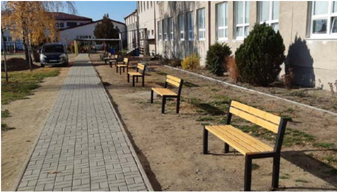
Školský dvor v novom šate