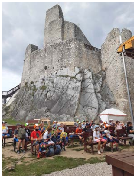
Deti na exkurzii hradu počas školy v prírode

11. januára 2021 bolo vyučovanie opäť mimoriadne prerušené. Výchovno-vzdelávacie proces prebiehal v MŠ a ŠKD, kde boli uprednostnené deti a žiaci zákonných zástupcov pracujúcich v kritickej infraštruktúre a zákonných zástup-