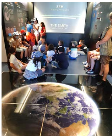
Deti na výstave Zem