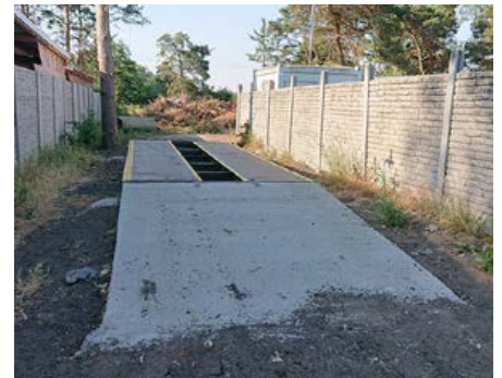
Váha na zbernom dvore

Veľká zmena bude v tom, že na zbernom dvore sa už nebude prijímať žiadny komunálny odpad. Komunálny odpad patrí do popolnice a nebude občanovi umožnené uložiť ho na zbernom dvore. Zberný dvor prijme iba vyseparované zložky odpadu a veľkoobjemový odpad, ktorým je odpad, ktorý kvôli svojim rozmerom a hmotnosti nie je možné umiestniť do bežných zberných nádob a kontajnerov. Patrí sem napríklad: nábytok, koberce, sanitárna