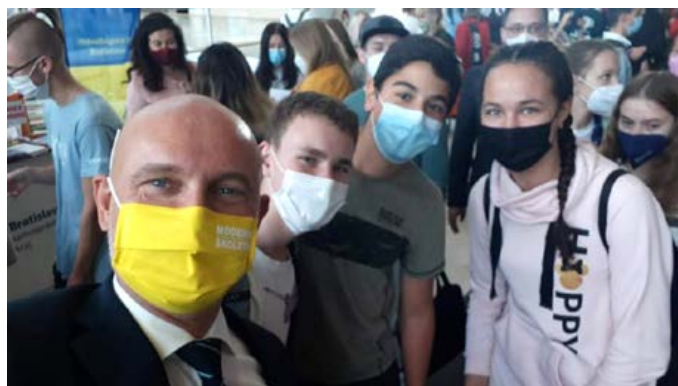
Naši deviataci na výstave stredných škôl v Bratislave - foto s ministrom školstva

Prostredníctvom dostupného doučovania, a v rámci projektu „Spolu múdrejší“, sme sa pokúsili vytvoriť podmienky na zlepšenie ich vedomostí, zručností a kompetencií v stanovenom rozsahu v hodinách mimo vyučovania. Tak sme minimalizovali a eliminovali opakovanie ročníka našich žiakov.