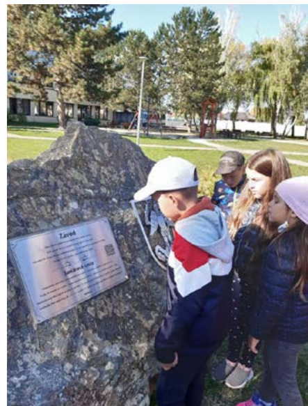
Žiaci v našej obci pri pamätníku