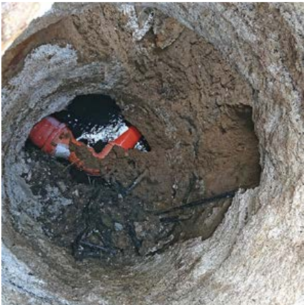
Výmena 17 ks kanalizačných šacht

V súčasnej dobe prebieha výmena sedemnástich starých kanalizačných šacht na trase Gajary, Malé Leváre, Veľké Leváre a Závod, cez ktoré vedie potrubie so splaškovými vodami priamo do čistiarne odpadových vôd v Gajaroch. Pôvodné kanalizačné šachty vplyvom dlhoročného pôsobenia splaškových vôd poznamenali ich funkčnosť a stav, ktorý bol havarijný. Väčšina šacht bola rozpadnutá a neplnila dostatočne svoj účel. Preto bolo nevyhnutné pristúpiť ku kroku, kedy sa vymenia staré šachty za nové. Táto „akcia“ je financovaná z vlastných zdrojov obcí Gajary, Malé Leváre, Veľké Leváre a Závod.