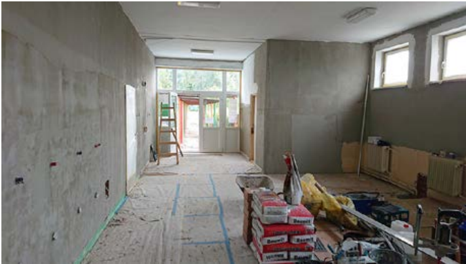
Rekonštrukcia šatní v ZŠsMŠ