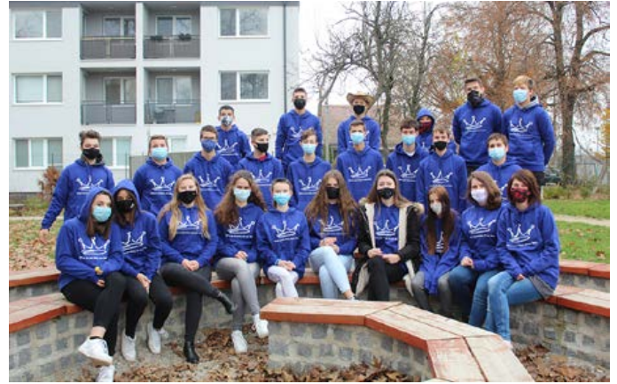
Naši deviataci v ich absolventských mikinách v parku školy

V júni 2021 sa nám podarilo zabezpečiť a zrealizovať výchovno-vzdelávaciu aktivitu s environmentálnou tematikou v katastri CHKO „Červený rybník“. Náučný chodník a výstavu dravcov s odborným výkladom si vypočuli a prezreli postupne deti MŠ, žiaci 1. stupňa ZŠ a žiaci 5. a 6. ročníka ZŠ.