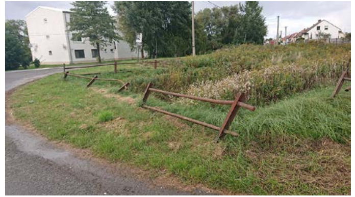
Výmena ochranného zábradlia