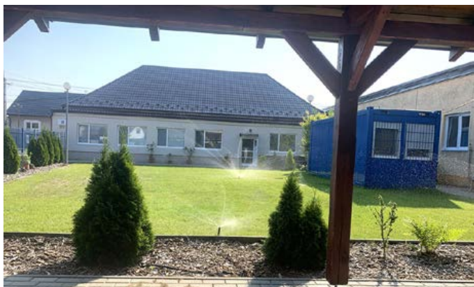
DSS - Dvor závlaha