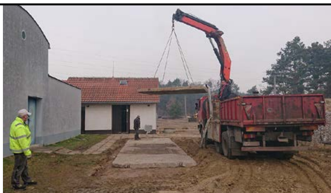
Práce na vodárni

Pokračujeme aj na modernizácii vodárne. Pre lepšiu kvalitu vody sme sa rozhodli, že upustíme od dezinfekcie vody chlórnanom sodným, ktorým sa voda u nás dezinfikuje od spustenia vodárne. V budúcom roku začneme používať zariadenie, ktoré nám bude čistý chlór vyrábať priamo na vodárni. Z vody takto zmiznú zostatkové chlorečnany, ktoré filtre nedokážu dokonale zachytiť a vo vode sú nežiadúce. Ideálne by bolo, ak by sme nechlórovali vôbec, ale vieme, že to nie je možné. Použitím modernejších technológií však siahneme aspoň po tom najlepšom, čo za prijateľné peniaze na trhu existuje.