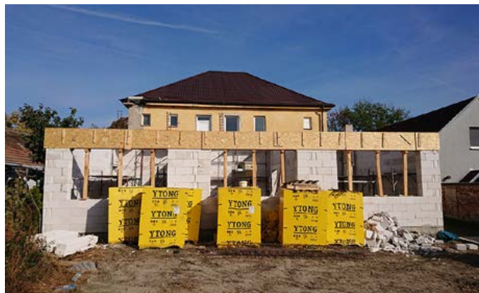
Prístavba zdravotného strediska