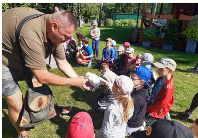
Naši žiaci na exkurzii - (u Dravcov)