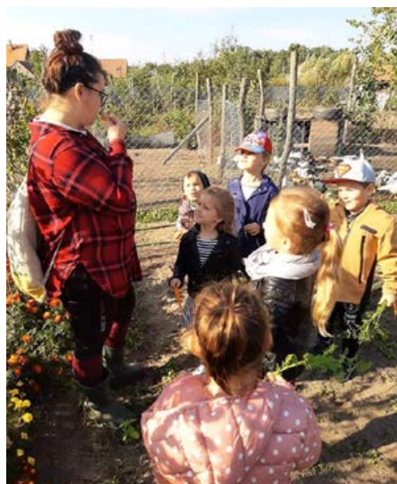
Deti z MŠ na farme