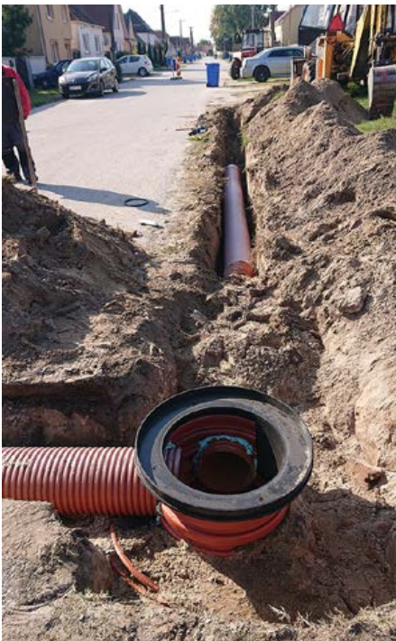
Budovanie dažďovej kanalizácie