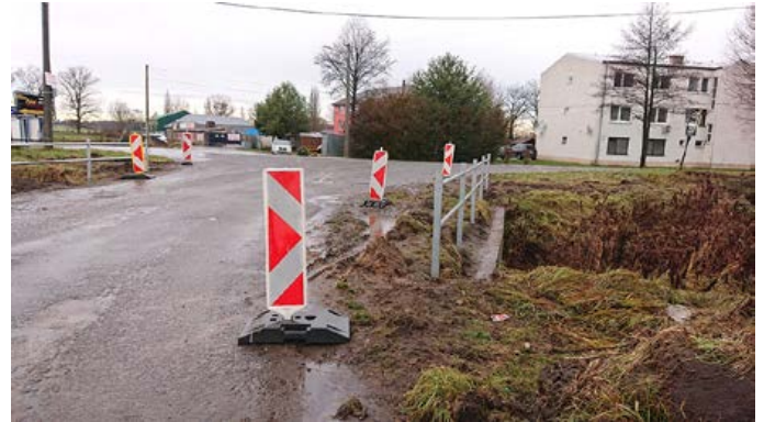
Výmena ochranného zábradlia