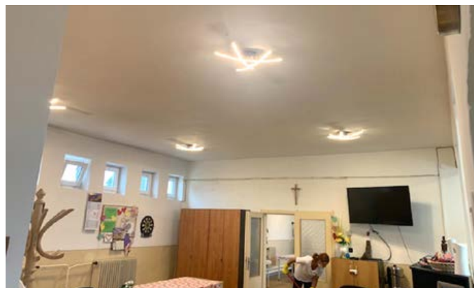
DSS - nové osvetlenie