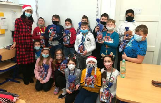
Žiaci ZŠ 5.B Mikuláš

V júni 2021 sa nám podarilo zabezpečiť a zrealizovať výchovno-vzdelávaciu aktivitu s environmentálnou tematikou v katastri CHKO „Červený rybník“. Náučný chodník a výstavu dravcov s odborným výkladom si vypočuli a prezreli postupne deti MŠ, žiaci 1. stupňa ZŠ a žiaci 5. a 6. ročníka ZŠ.