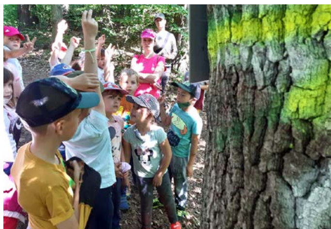
Naši žiaci na exkurzii - (u Dravcov)