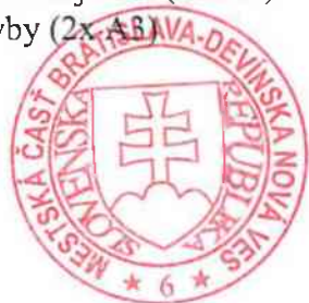
Dárius Krajčír starosta

Mestskej časti Bratislava Devínska Nová Ves